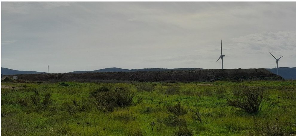
Figura 5. Vista del sopralzo moduli 3-7-8 da nord – 04/03/2025