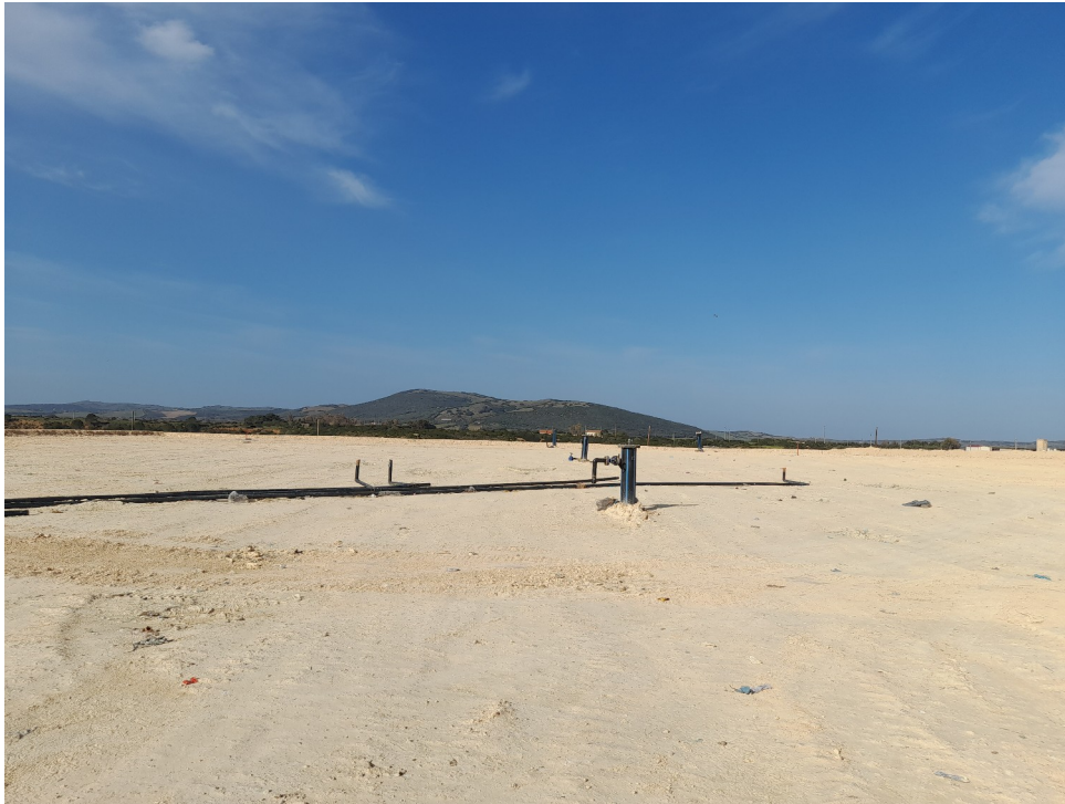
Figura 4. Vista del modulo 4 con copertura temporanea (da est – 04/03/2025)