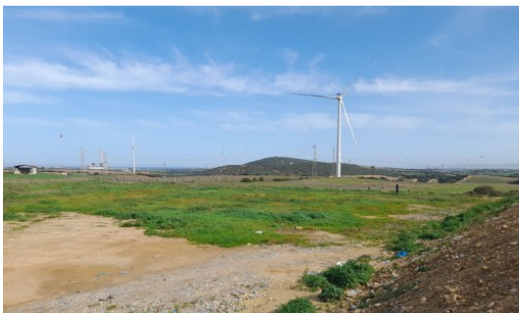
Figura 3. Vista del modulo 2 (04/03/2025) dalla strada di accesso in quota ai moduli a sud