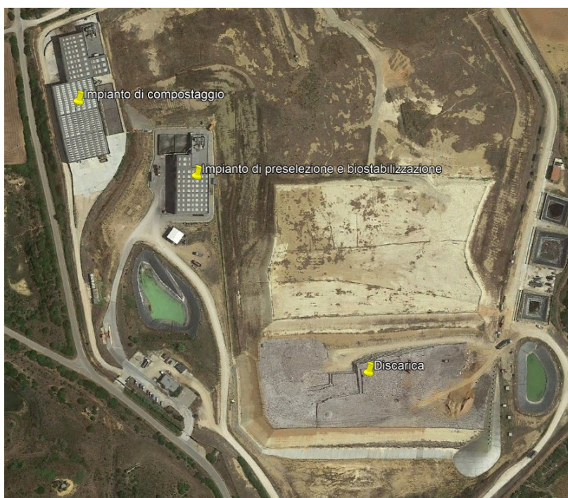
Figura 1. Foto aerea del Sito di smaltimento con evidenziati i tre impianti

Nelle foto seguenti viene riportata la sistemazione attuale del Sito.