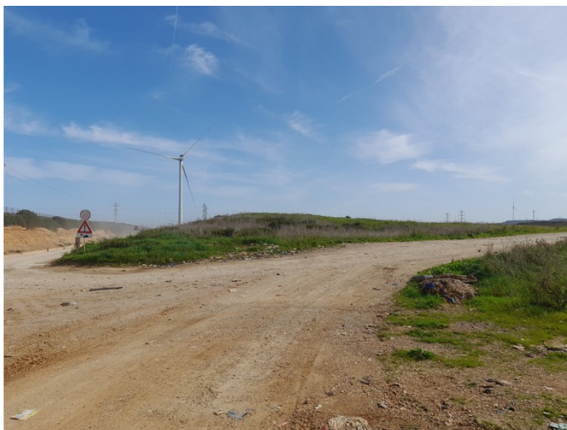
Figura 2. Vista del modulo 1 ((ante 36/2003) e della pista di accesso ai moduli a sud (04/03/2025)